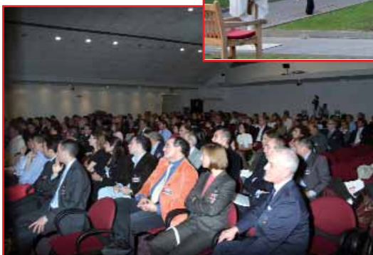
durante il congresso

ricercava nuovi stimoli. L'impegno delle diverse scuole è stato trasversale, coinvolgendo professionisti da tutta Italia, segno di una diffusione sempre più capillare dell'odontoiatria laser.