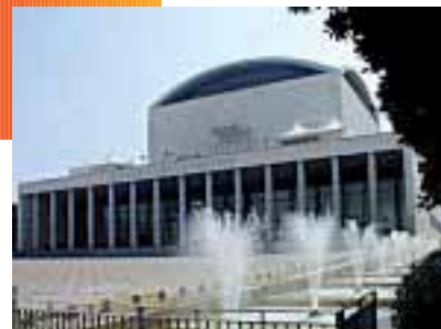
Il Palazzo dei Congressi di Roma, sede del prossimo Congresso del Collegio dei Docenti di Odontoiatria.

Il laser dimostra una volta ancora la sua versatilità e le sue molteplici possibilità d'impiego e fornisce un ulteriore stimolo per approfondimenti e ricerche, come la SILO propone